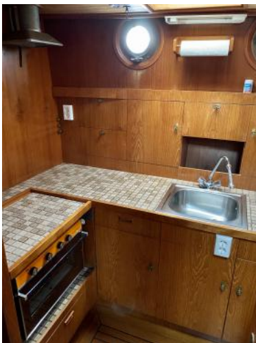
Pantry Ansicht 2