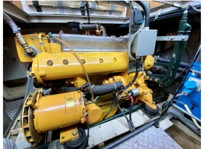
Motor Ansicht 1