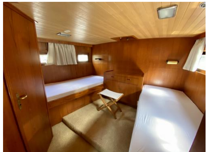
Achterkabin Ansicht 1