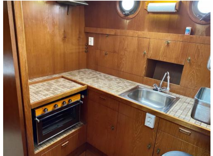
Pantry Ansicht 1