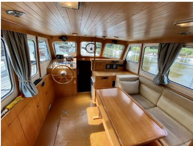
Salon Ansicht 1