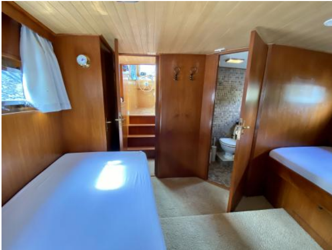
Achterkabine Ansicht 2