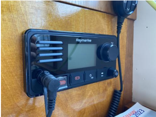
UKW-Funk neu 2021