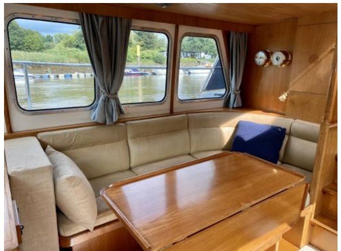
Salon Ansicht 2