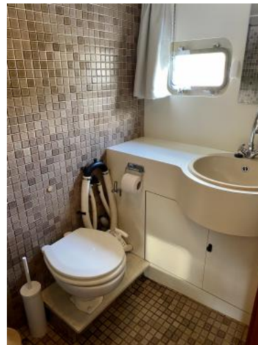
Bad Achterkabine Ansicht 2