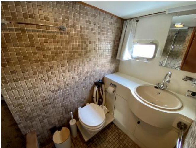
Bad Achterkabine Ansicht 1