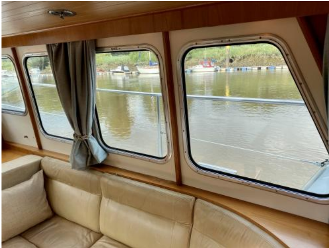
Salon Ansicht 3