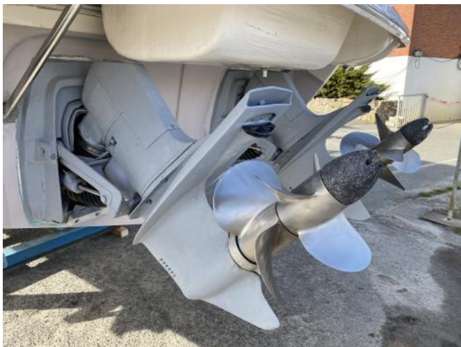
Z-Antriebe Ansicht 1