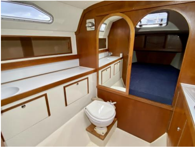
WC-Raum Ansicht 1