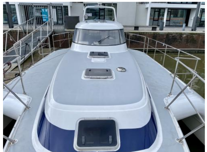
Deck Ansicht 1