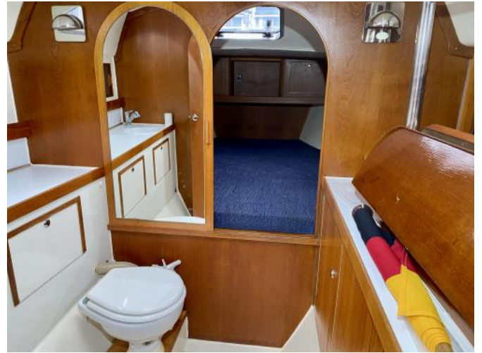
WC-Raum Ansicht 2