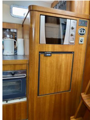
Mikrowelle / Kühlschrank