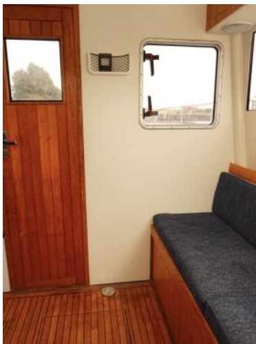
Fahrstand Blick nach achtern