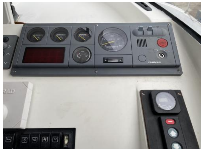
Instrumente Ansicht 1