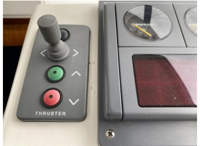
Instrumente Ansicht 3