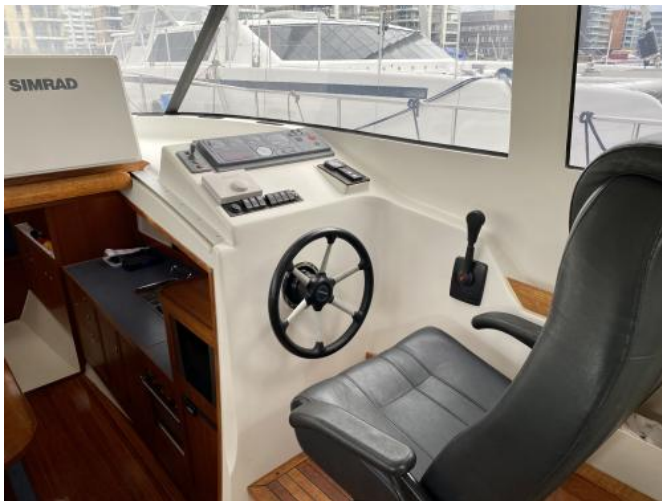
Steuerhaus Ansicht 2