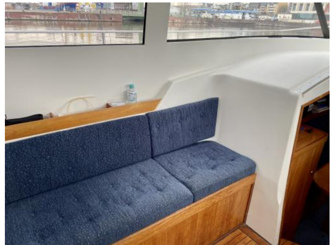
Sitzbank im Steuerhaus