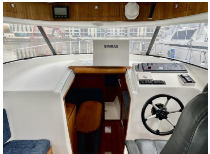
Steuerhaus Ansicht 1