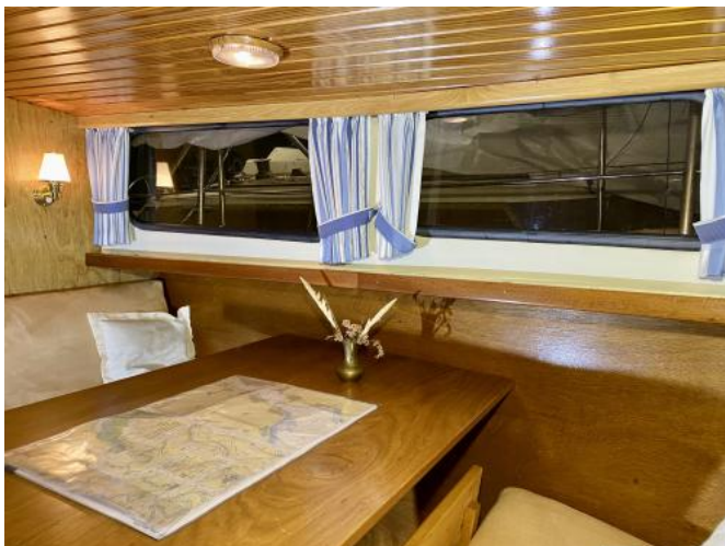
Dinette in Bugkabine Ansicht 2