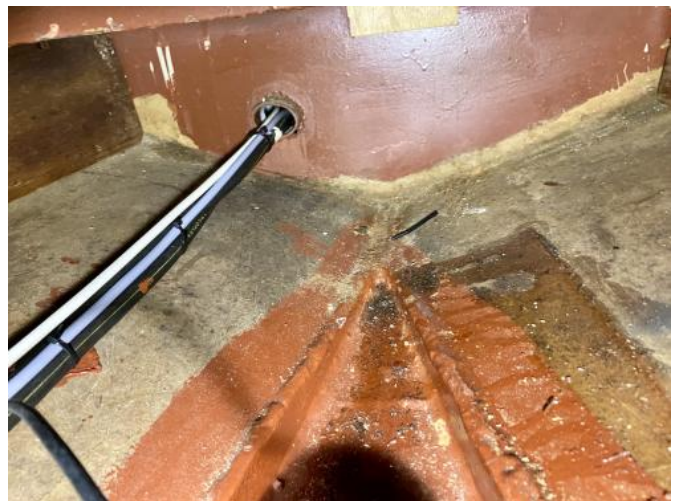
Bilge Bugbereich Ansicht 2