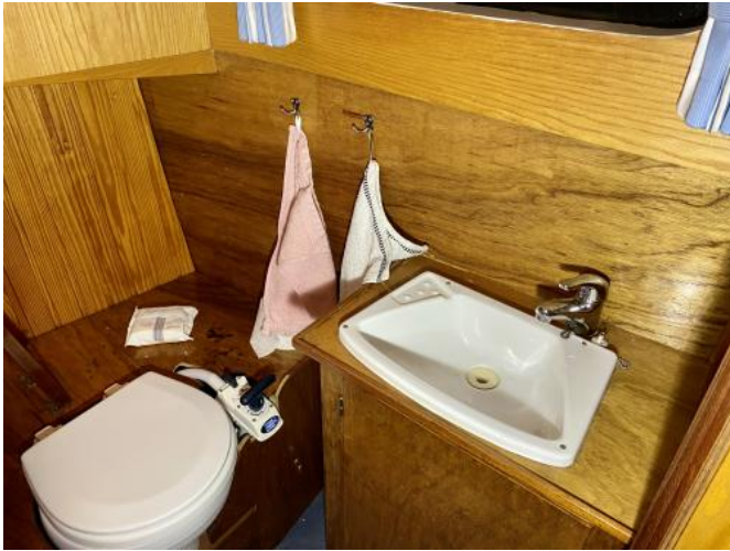
WC-Raum Ansicht 2