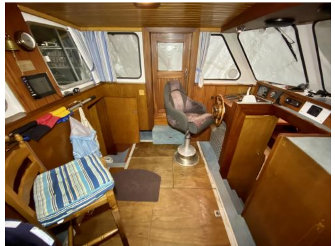
Cockpit Ansicht 2