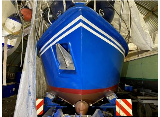
Bugansicht auf Trailer