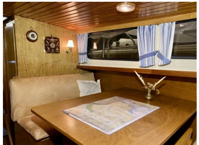
Dinette Ansicht 3