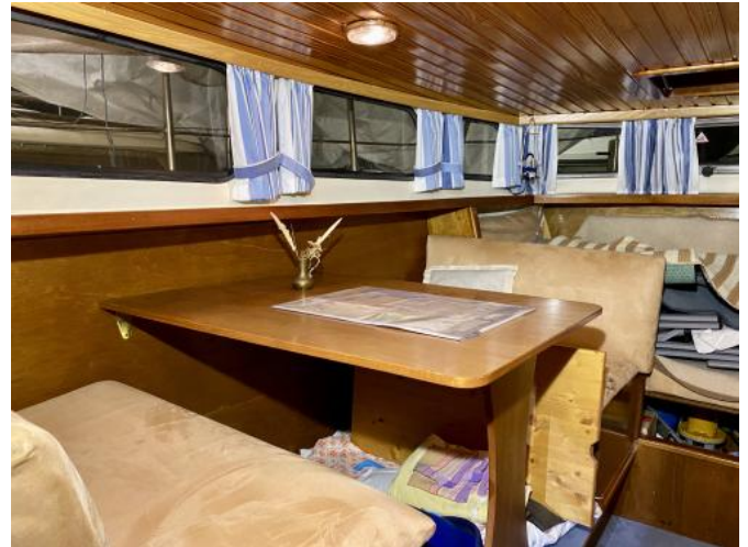
Dinette in Bugkabine Ansicht 1