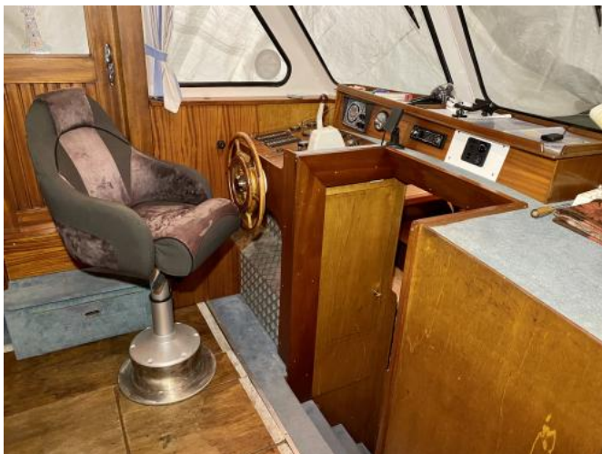
Fahrstand Ansicht 1