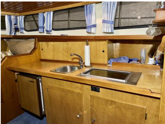
Pantry Ansicht 1