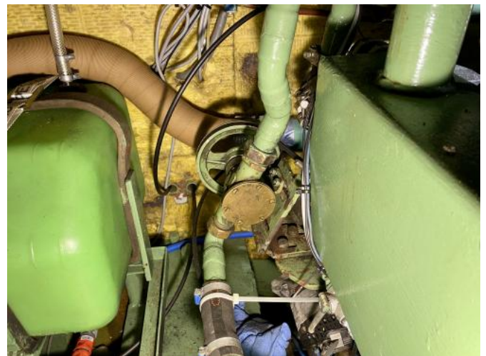
Impellerpumpe gut zugänglich