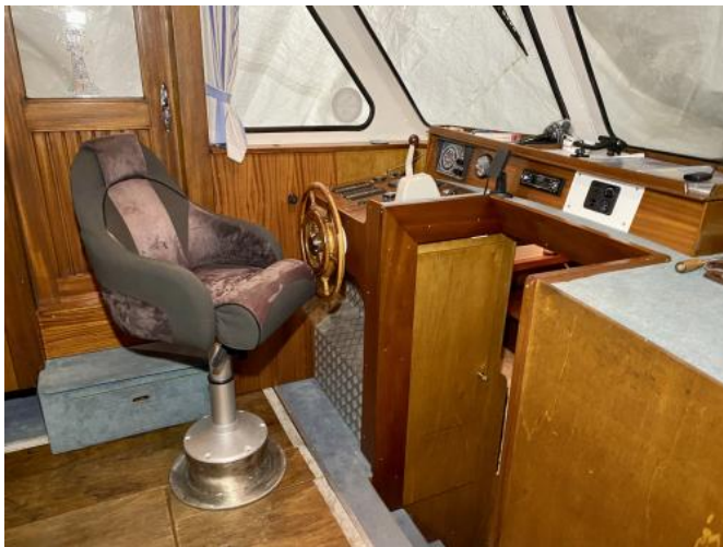
Cockpit Ansicht 1