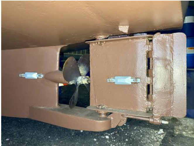
Propeller und Ruderblatt