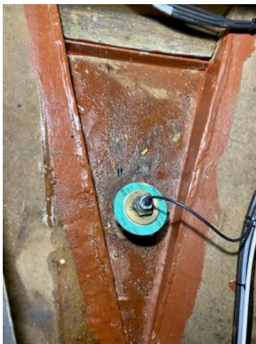
Bilge Bugbereich Ansicht 1