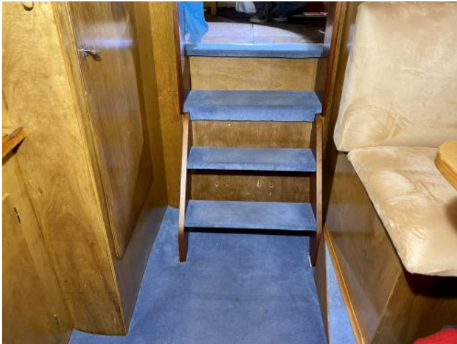
Niedergang zwischen Bugkabine und Cockpit