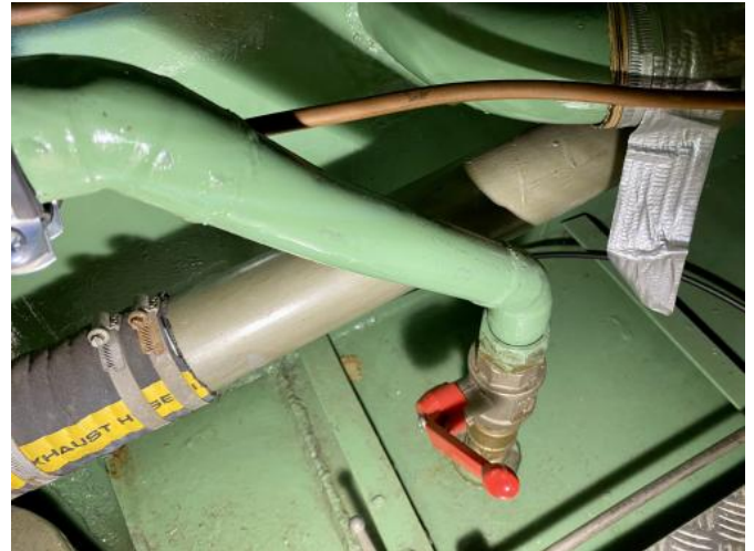
Seeventile Ansicht 1