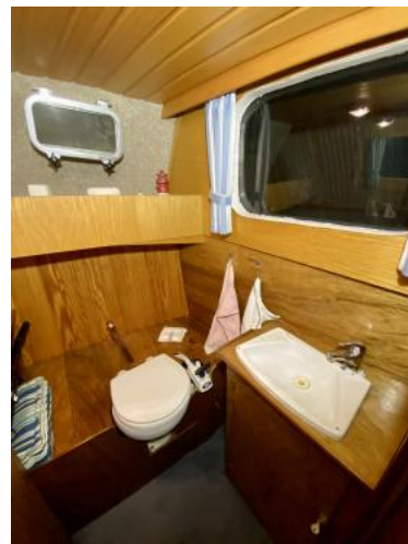
WC-Raum Ansicht 1