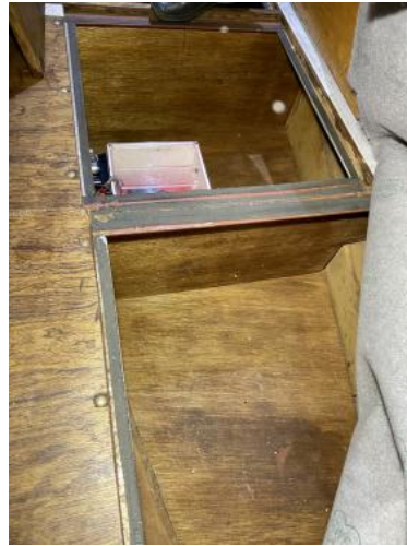
Bilge ausgekleidet im Salon