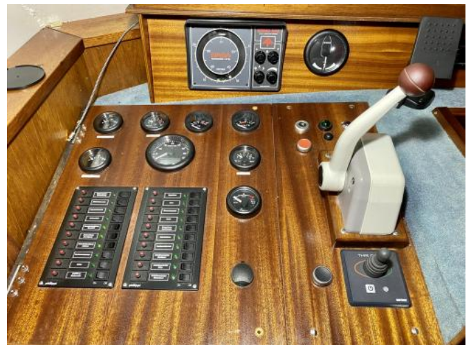
Fahrstand Ansicht 2