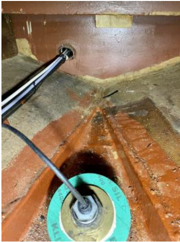
Bilge Bugbereich Ansicht 3