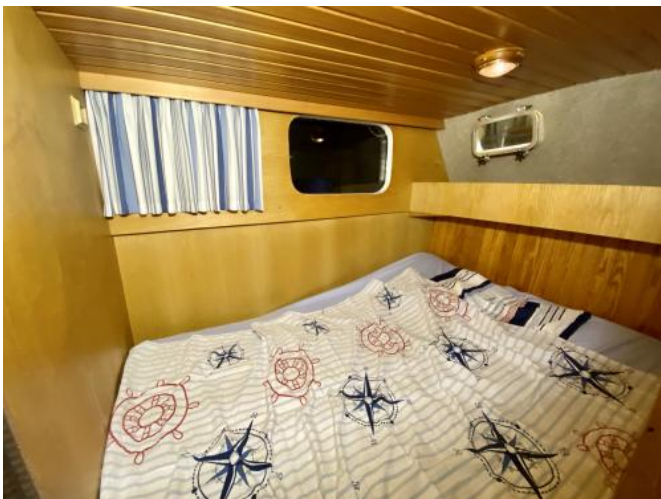
Eignerkoje in Achterkabine