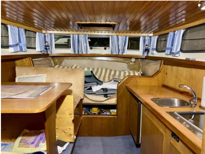
Bugkabine Ansicht 1