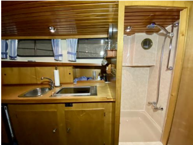
Dusche in Bugkabine an Pantry