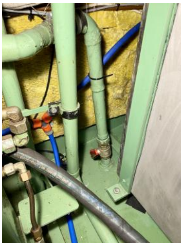
Seeventile Ansicht 2