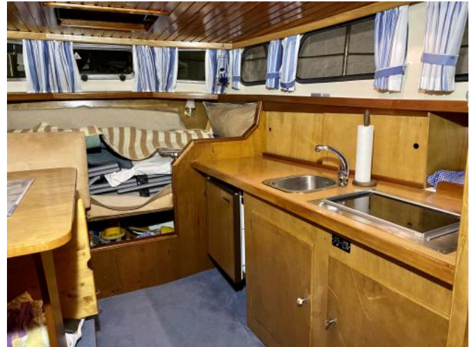
Bugkabine Ansicht 2