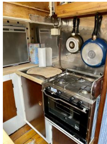
Pantry Ansicht 1