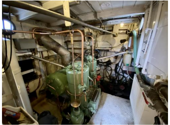
Motor Ansicht 2