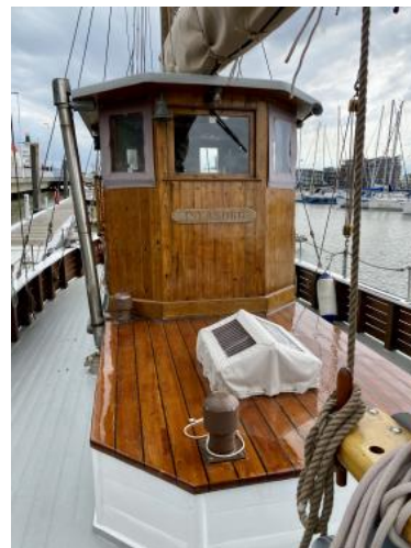
Ruderhaus Ansicht 2