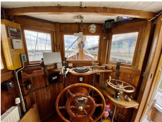
Innenansicht Ruderhaus 2