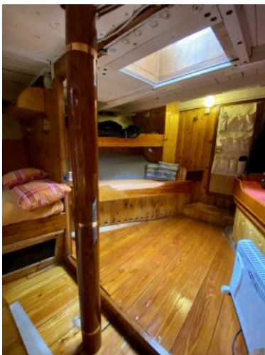
Kabine Ansicht 3