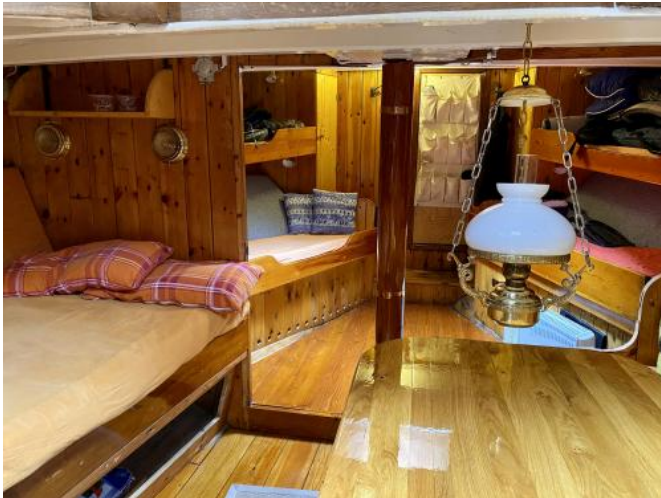
Kabine Ansicht 1