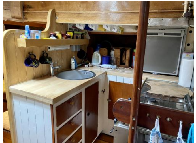
Pantry Ansicht 2