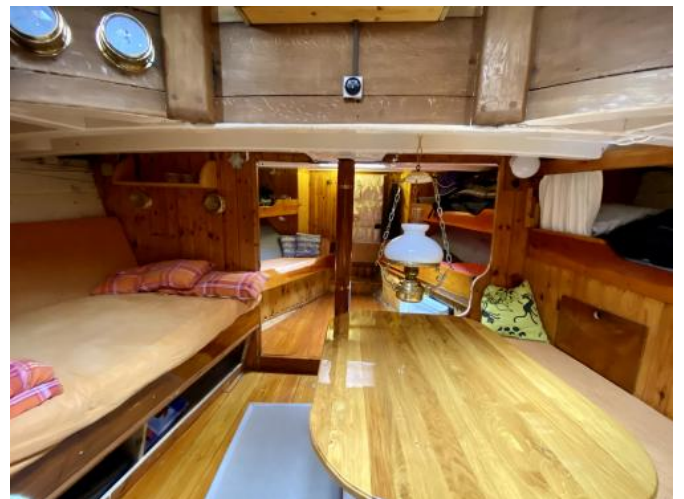
Kabine Ansicht 4