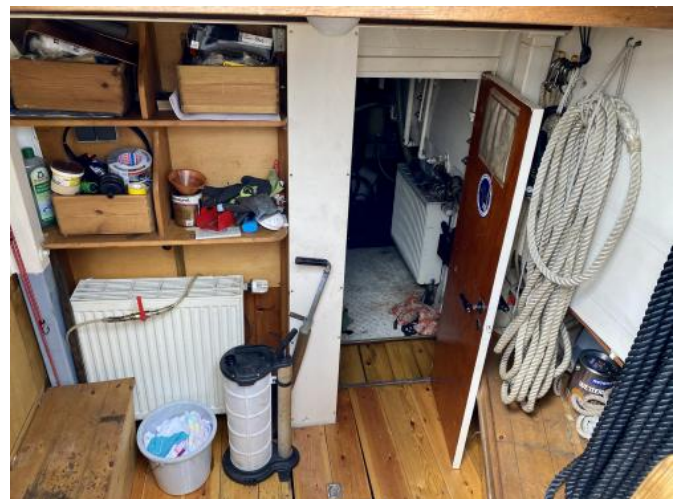
Vorraum vom Motorraum / Werkstatt