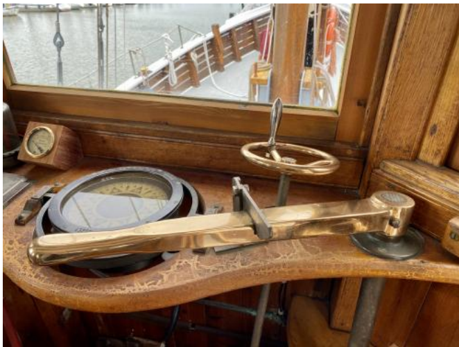
Fahrstand Ansicht 2