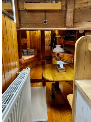
Kabine Ansicht 6