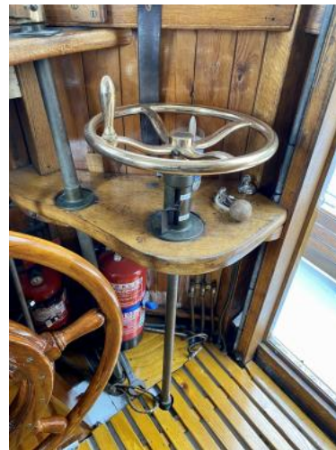
Fahrstand Ansicht 3