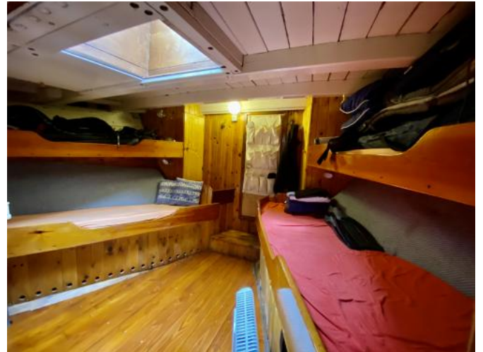
Kabine Ansicht 2