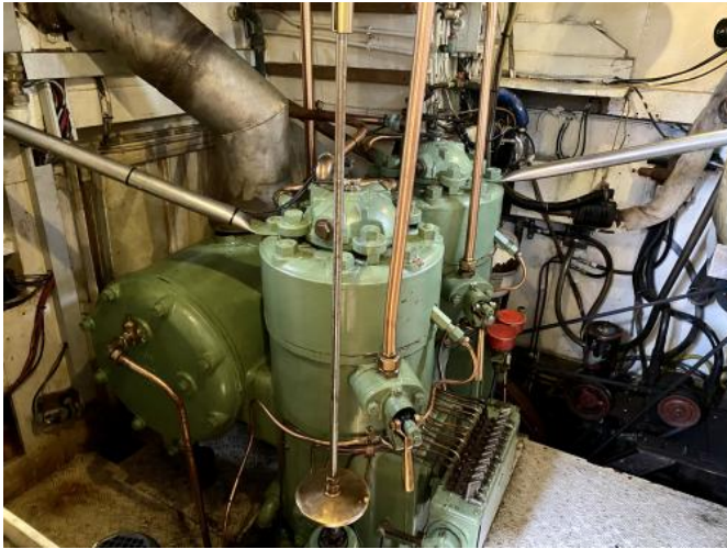
Motor Ansicht 1