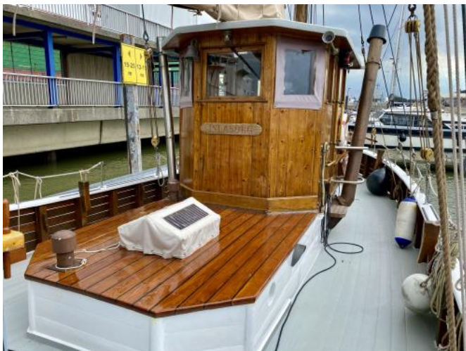
Ruderhaus Ansicht 1