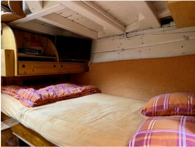
Kabine Ansicht 5