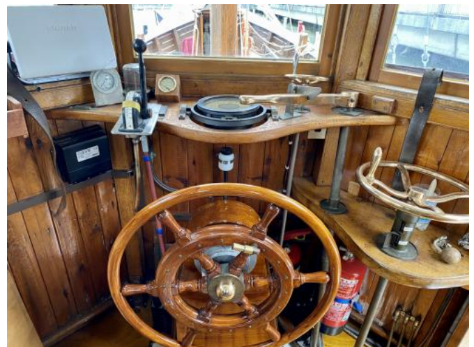
Fahrstand Ansicht 1