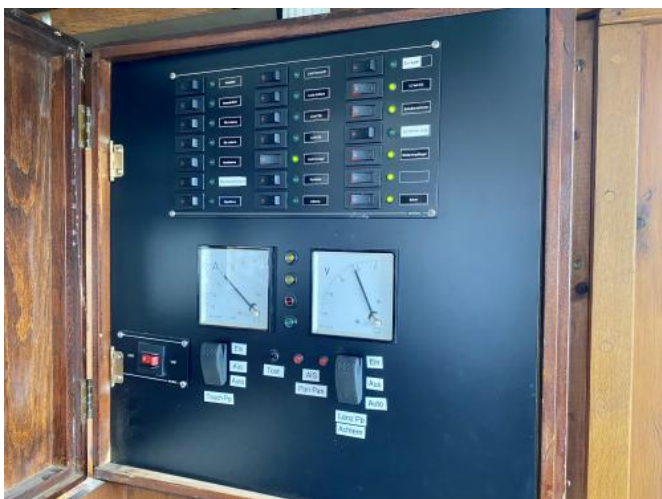
Schalttafel / Elektrik Ansicht 1