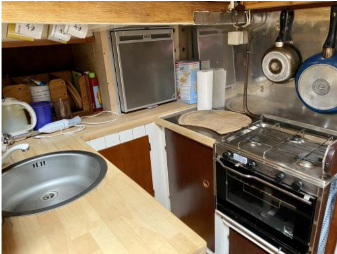
Pantry Ansicht 2