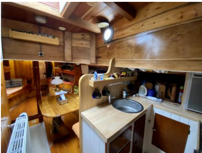
Kabine Ansicht 7