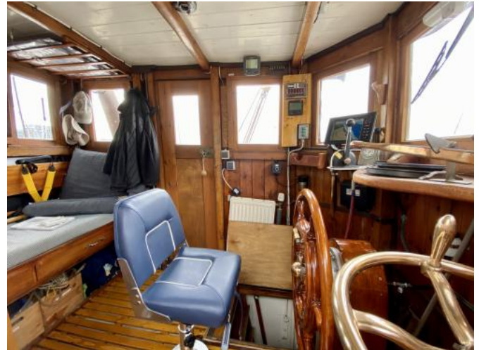
Innenansicht Ruderhaus 1