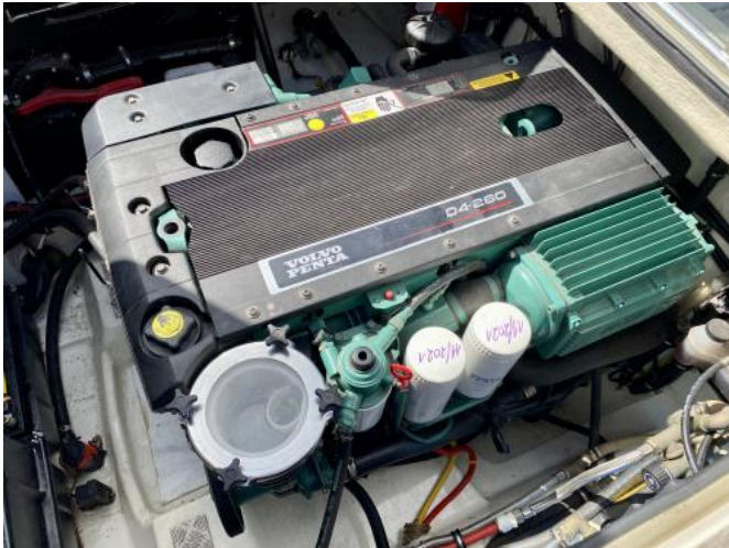
Motor Ansicht 1