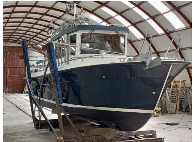
Ansicht an Land