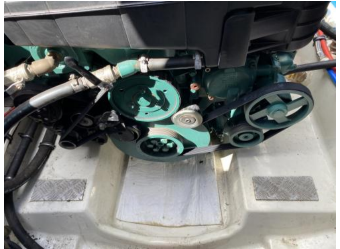
Motor Ansicht 2