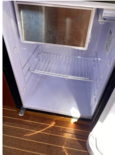
Kühlschrank Ansicht 2