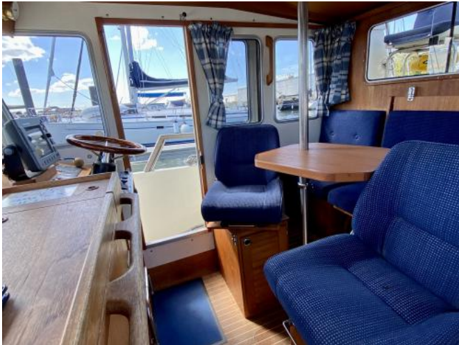
Cockpit Ansicht 1