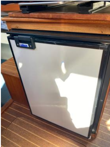
Kühlschrank Ansicht 1