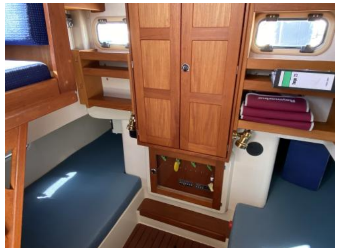
Kojen achtern Ansicht 2