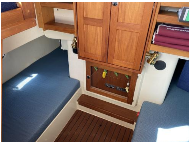
Kojen achtern Ansicht 1