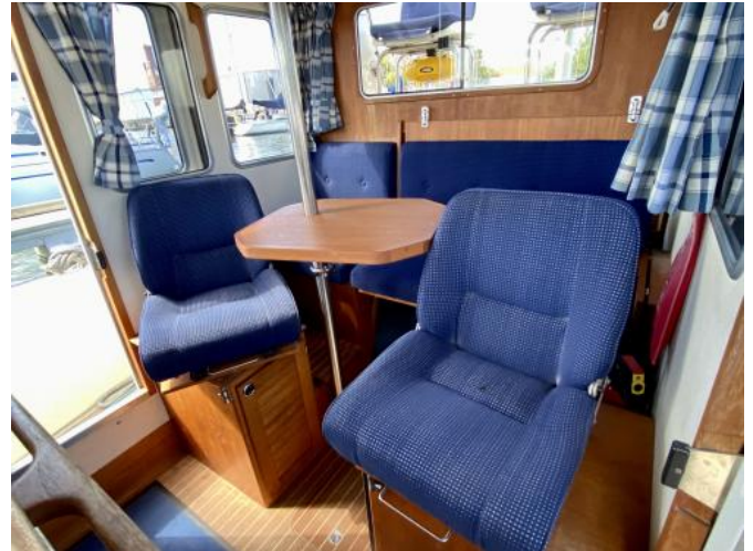
Cockpit Ansicht 2