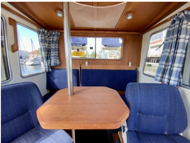
Cockpit Ansicht 3