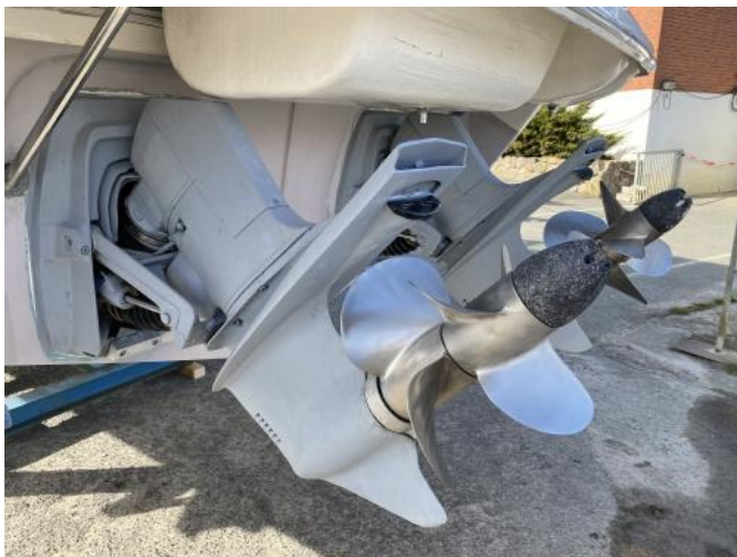
Z-Antriebe Ansicht 1