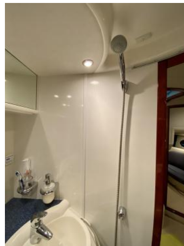
WC-Raum Ansicht 2