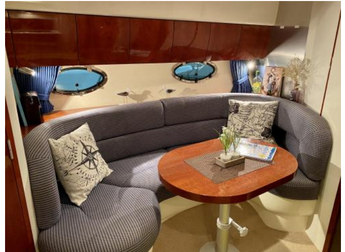
Sitzbereich unter Deck