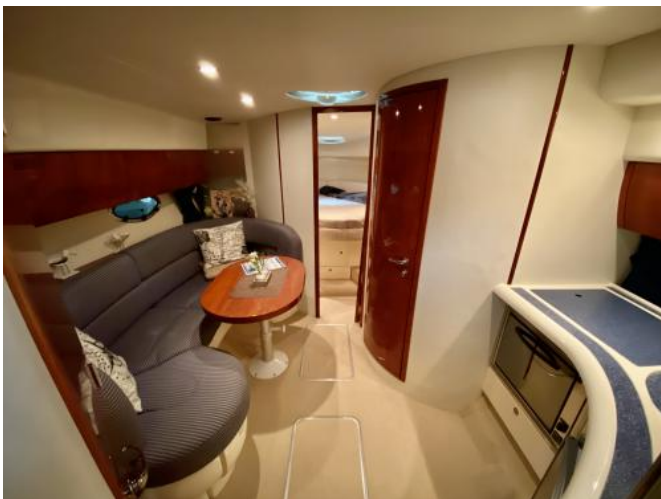
Salon Ansicht 1