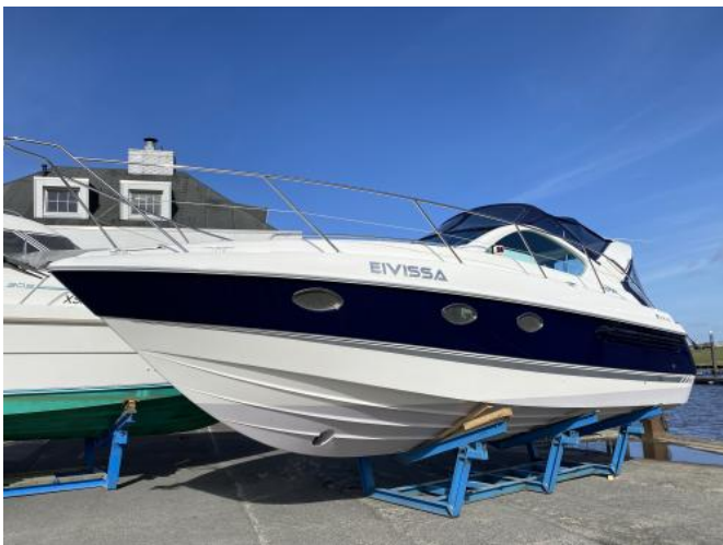
Ansicht auf Lagerbock