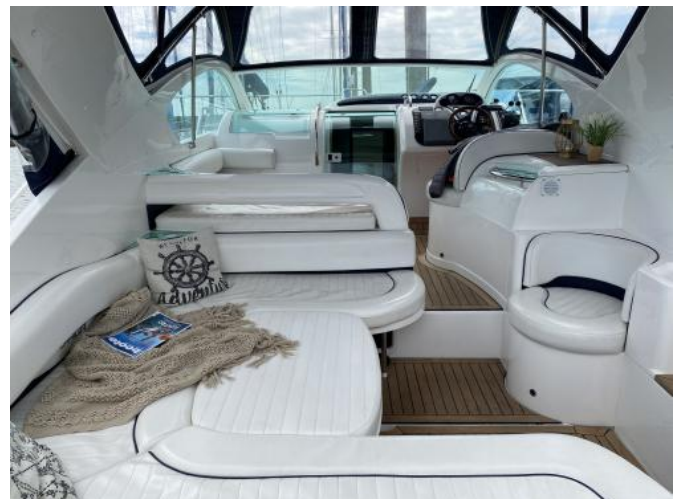
Plicht / Cockpit