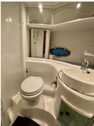
WC-Raum Ansicht 1