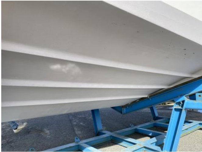
UW-Schiff Ansicht 2