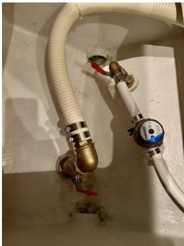
Seeventile neu 2021