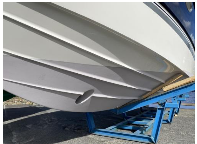
UW-Schiff Ansicht 1