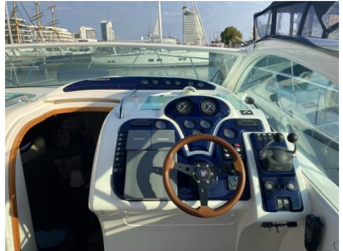
Cockpit / Fahrstand