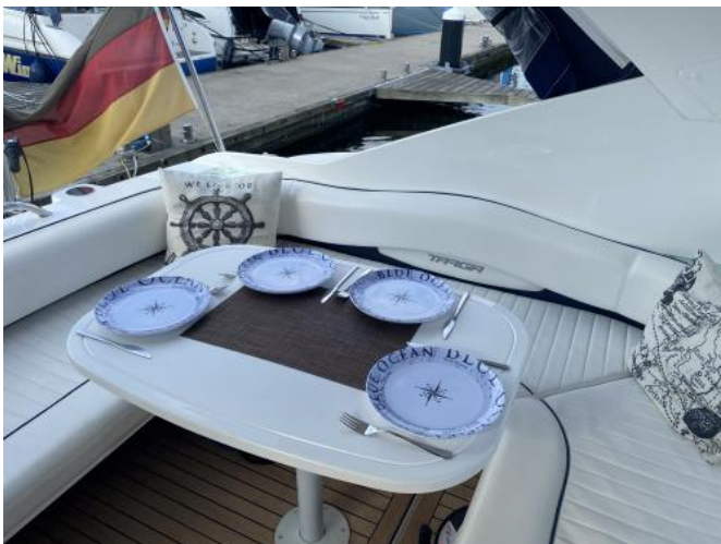
Plicht / Sitzbereich achtern