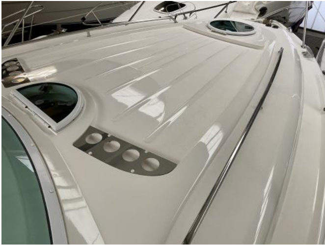
Deck Ansicht 1