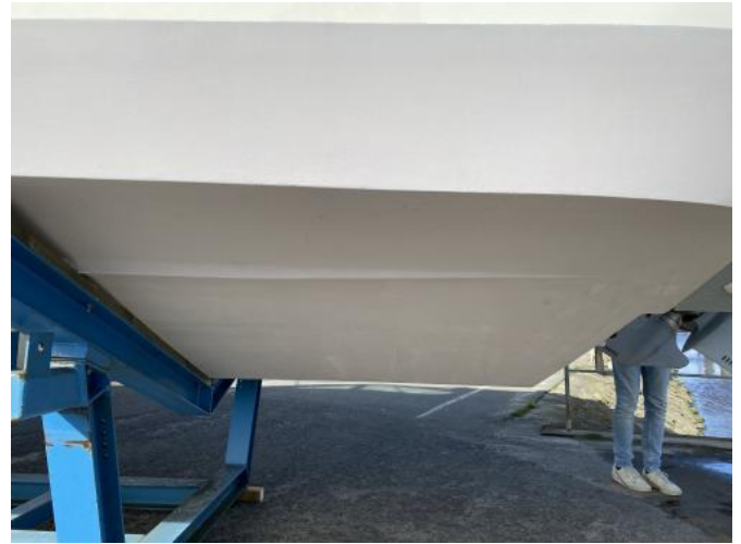
UW-Schiff Ansicht 3