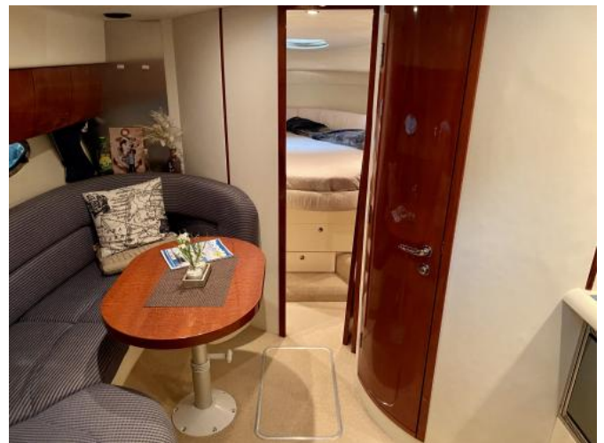
Salon Ansicht 2