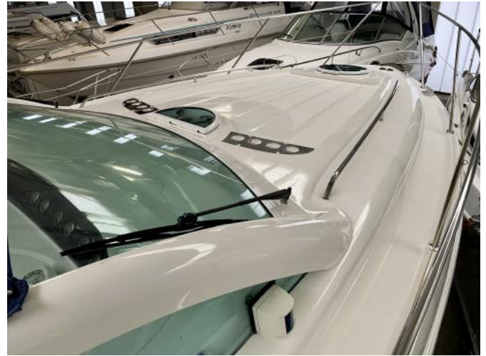
Deck Ansicht 2