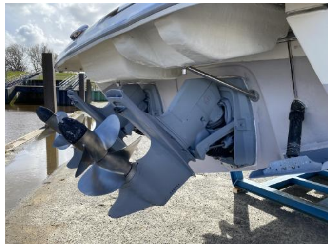
Z-Antriebe Ansicht 2